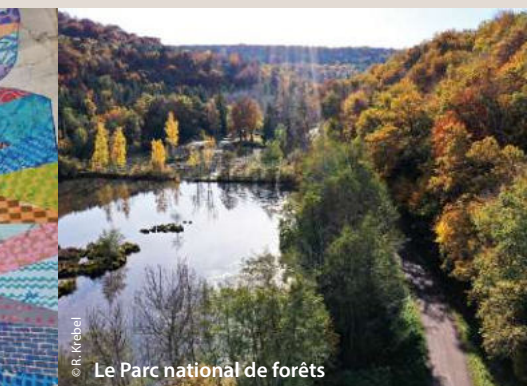
Le Parc national de forêts