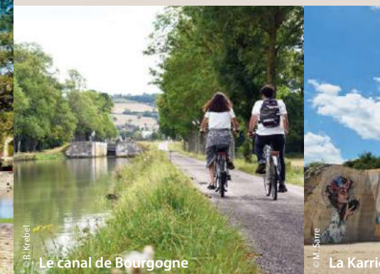
Le canal de Bourgogne