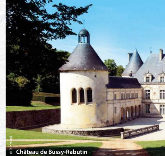
Château de Bussy-Rabutin