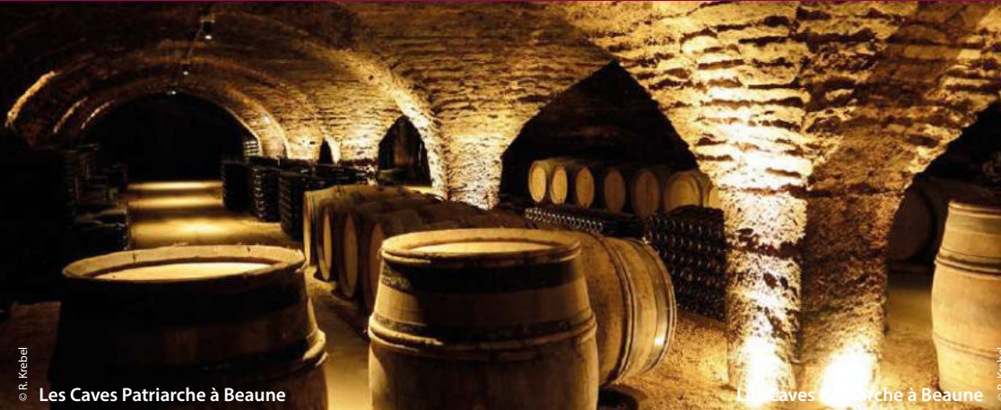
Les Caves Patriarche à Beaune