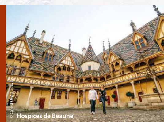
Hospices de Beaune

Des Celtes à la Renaissance, sans oublier les célèbres Ducs de Bourgogne, la Côte-d'Or se transforme en véritable frise chronologique. Ici, Vercingétorix a livré sa plus épique et dernière bataille. Les pas des moines cisterciens résonnent encore dans les abbayes millénaires. Le duché de Bourgogne rayonne toujours et les châteaux créent de vrais décors devant lesquels s'émerveiller. Deux des Plus Beaux Villages de France surplombent une campagne de carte postale et on ne se lasse pas de contempler le vignoble historique, inscrit au Patrimoine mondial de l'UNESCO.