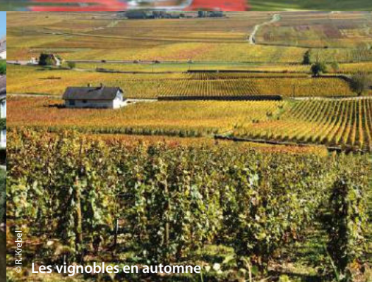
Les vignobles en automne