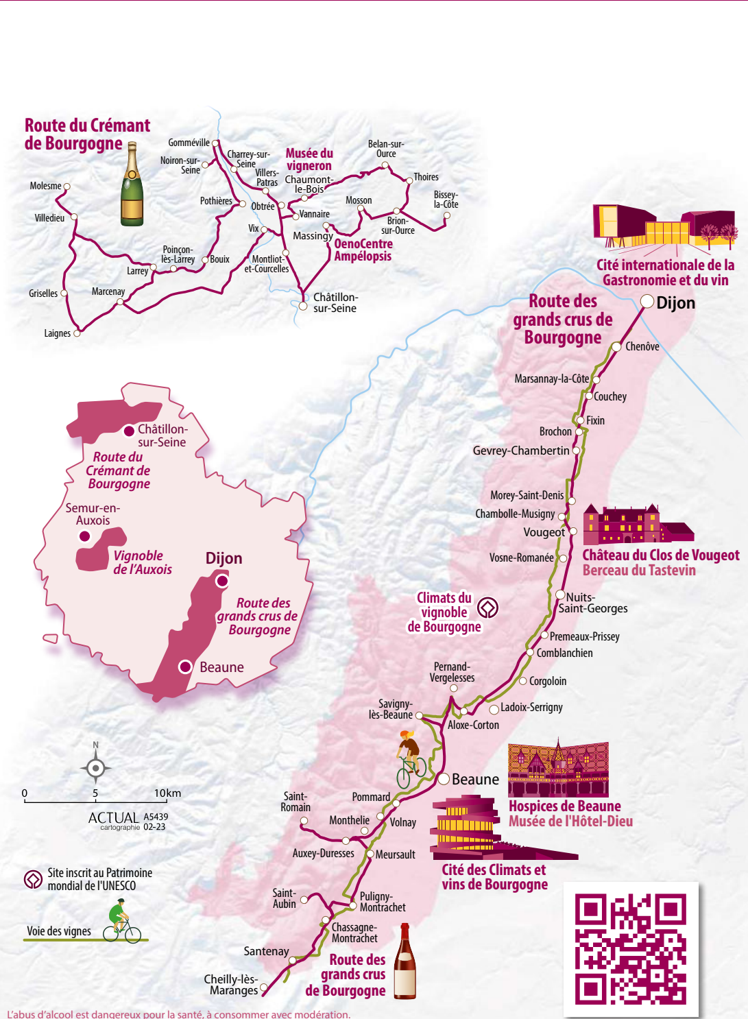
Labus d'alcool est dangereux pour la santé, à consommer avec modération.